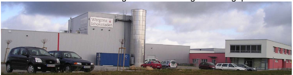
Die Wergona Schokoladen GmbH am Neustädter Ring 4

Ihre schwungvolle Entwicklung setzte die Wergona Schokoladen GmbH auch 2006 fort. Sie erweiterte ihre Produktions- und Lagerflächen erheblich und bereitete den Ausbau ihrer Kapazitäten durch den Erwerb von weiteren Flächen vor. Inzwischen wird in Wernigerode die Schokolade nicht nur verarbeitet, sondern auch produziert. Insgesamt arbeiten hier in Spitzenzeiten, so in der Saison 2006, bis zu 400 Mitarbeiter. Für die kommenden Jahre sind Erweiterungen im Verwaltungsbereich geplant.