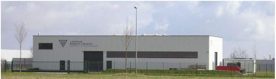
Der neue Sitz der Fengler Uhlmann Waagenbau GmbH

Das Wernigeröder Familienunternehmen Fengler Uhlmann Waagenbau GmbH hat den Sprung aus der Innenstadt auf die grüne Wiese gewagt. Die Firma beliefert Unternehmen der deutsche Gießereiindustrie mit Spezialanfertigungen für den Kokillenguss. Dies muss sie in Zukunft nicht mehr in einer innerstädtischen Problemlage tun, sondern kann alle Vorteile eines modernen Wirtschaftsstandortes mit ausreichend nutzen.