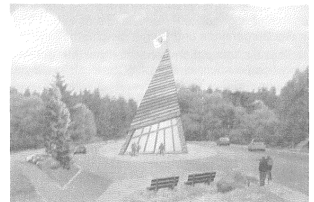
Entwurf des Ortseinganges in Form einer großen Köhlerhütte mit Touristinformation von Prof. Dr. Eisentraut